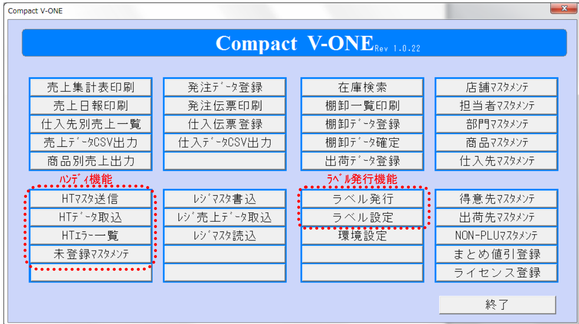
(Ver4.0 メインメニュー画面)